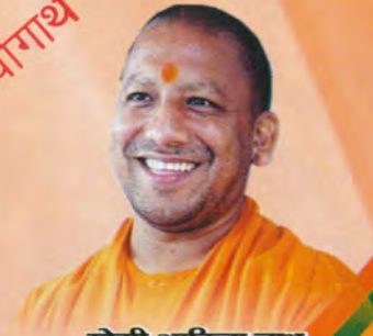
योगी आदित्य नाथ माननीय मुख्यमंत्री, उ.प्र.