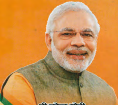
श्री नरेन्द्र मोदी माननीय प्रधानमंत्री, भारत सरकार